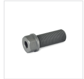
Kugeltragbolzen GN 1130