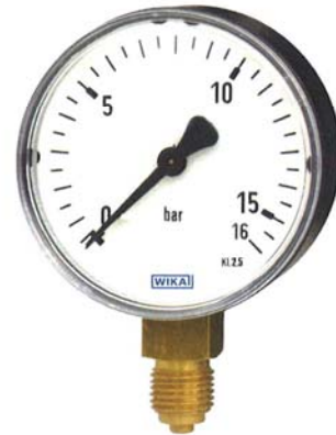
Druckmessgerät mit Rohrfeder Typ 111.10